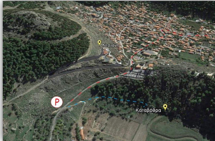
Εικόνα: Πρόσβαση πεδίου "Καταβόθρα".

Φτάνοντας στην κεντρική πλατεία του οικισμού της Νεστιάνης, κατευθυνόμαστε προς το νεκροταφείο του οικισμού (ακολουθούμε την ταμπέλα που αναγράφει προς "Φιλίππειος κρήνη"). Στη συνέχεια αφού περάσουμε το νεκροταφείο, αφήνουμε το όχημα μας στον πρώτο χωματόδρομο που συναντάμε στα αριστερά μας.