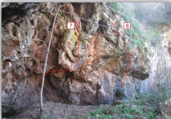
Εικόνα: Τομέας Α.