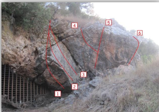
Εικόνα: Τομέας Β.