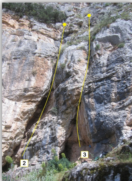
Εικόνα: Διαδρομές πεδίου.