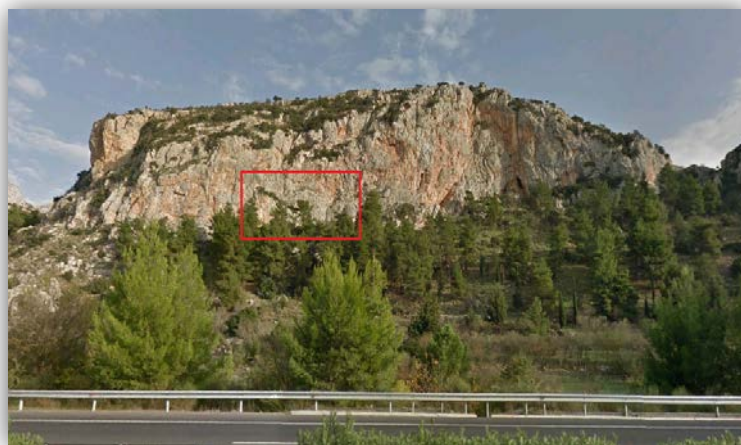
Εικόνα: Πεδίο "Βουλωμένη".

Το πεδίο διαθέτει 13 διαδρομές από V- έως VII με ανάπτυγμα από 20 έως 25 μέτρα. Η διάνοιξη των διαδρομών χρηματοδοτήθηκε από τον ΕΟΣ Τρίπολης τον Σεπτέμβρη του 2000 στα πλαίσια σχολής αρχαρίων αναρρίχησης που είχε διοργανώσει εκείνη την εποχή.