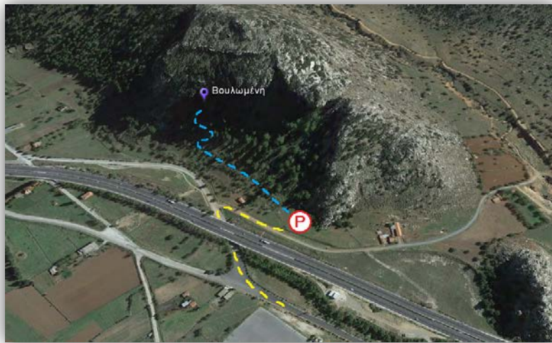
Εικόνα: Πρόσβαση πεδίου "Βουλωμένη".

Λίγο πριν φτάσουμε στον οικισμό της Νεστάνης Αρκαδίας, στρίβουμε δεξιά περνώντας κάτω από τη γέφυρα του αυτοκινητόδρομου Αθήνα-Τρίπολη και αμέσως στρίβουμε δεξιά σε καλής ποιότητας χωματόδρομο. Οδηγούμε για περίπου 50 μέτρα και αφήνουμε το όχημα μας στα αριστερά του δρόμου.